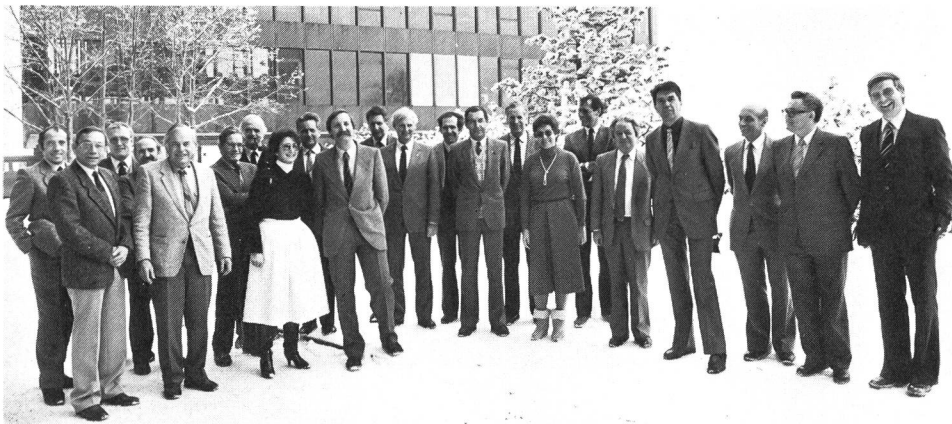
La Commission fédérale de gymnastique et de sport (CFGS), organe d'Etat supérieur chargé des intérêts du sport, et autorité de surveillance de l'EFGS, ici devant le bâtiment principal de l'EFGS à l'occasion de sa première session: de gauche à droite: