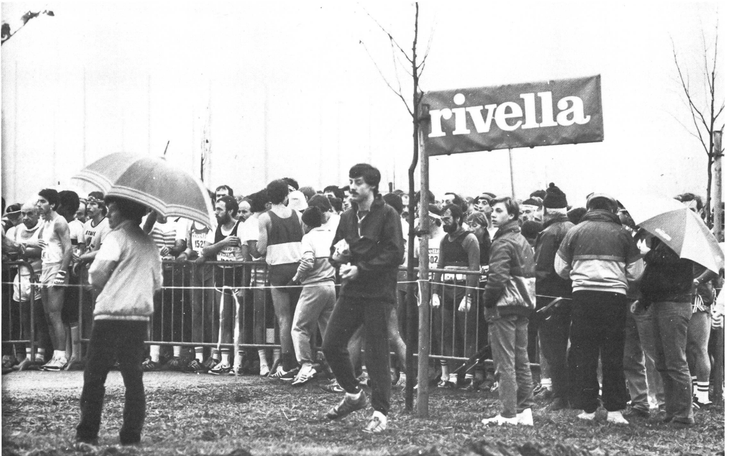
Ces photos ont été prises lors du championnat suisse de marathon à Tenero: «Départ dans trois minutes!»