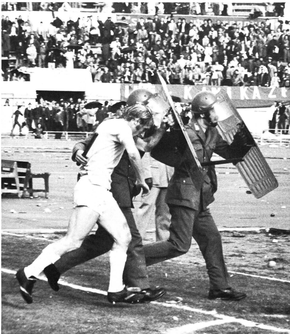
Un service d'ordre efficace dès avant le match, pour ne pas en arriver là.

En outre, nous organisons régulièrement des rencontres avec les comités des «fans-clubs» (ils sont très nombreux en Suisse centrale). L'entraîneur et certains joueurs sont également présents et de nombreuses divergences de vues peuvent être ainsi