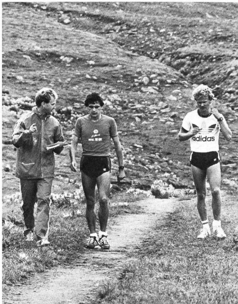
Ryffel et Millionig respectent, eux, l'adaptation à l'altitude.