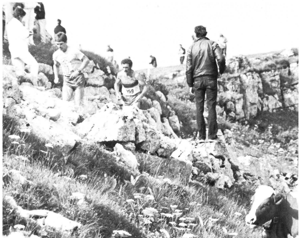
... ni la chaîne du Chasseral, bucolique et pourtant pleine d'embûches.