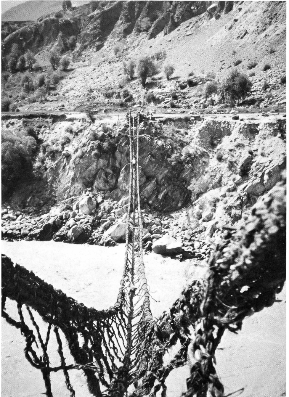
Himalaya et course à pied: deux notions incompatibles.

Le succès et la bonne réputation des courses de montagne et des autres épreuves d'endurance «populaires» sont à ce prix!