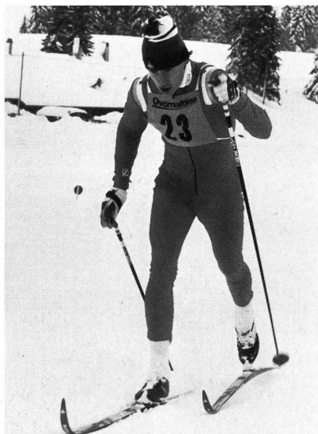
Gunde Svan (Suède) en technique classique...

Un projet d'interdiction des instances internationales ayant échoué, on en arriva pourtant à une sorte de demi-mesure: la prohibition du demi-pas de patineur pendant les 200 premiers et les 200 derniers mètres d'une épreuve!