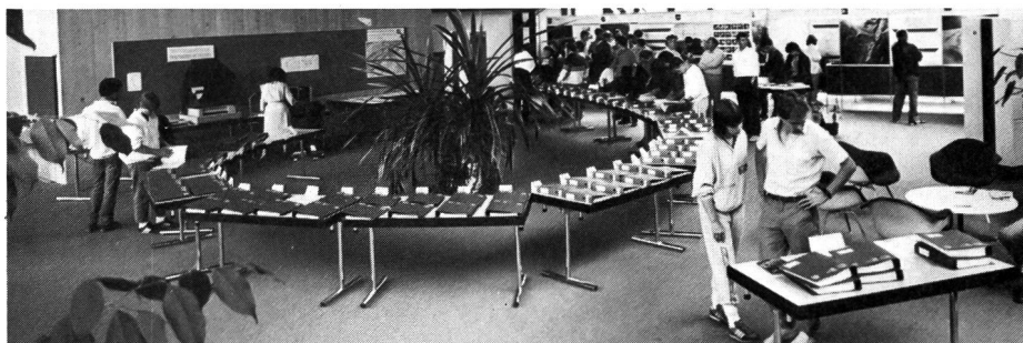
Les manuels J+S exposés à l'aula de l'EFGS.