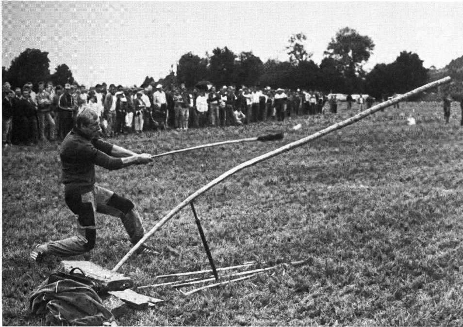
Démonstration de tsan à Studen en 1985.