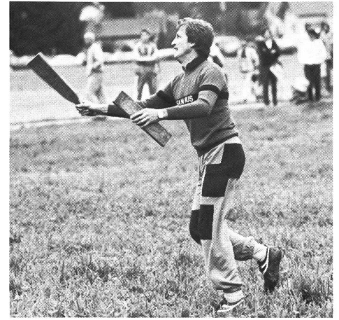
Intercepteur en attente.

Au moyen d'une baguette renforcée à l'avant, une équipe projette le «tsan»,