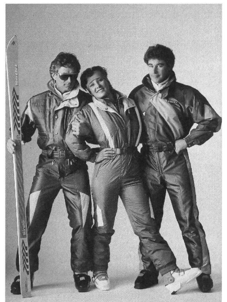
Le champion – ici, au centre, Maria Walliser – suffit souvent à faire la qualité d'un produit: la publicité le sait et s'en sert; au prix fort!

Deuxièmement: le sport, en tant qu' activité de loisirs largement répandue, représente un défi économique pour l'industrie, le commerce, le secteur de la construction et le tourisme. Lorsque le plus sportif de nos conseillers fédéraux cite des chiffres, il sait de quoi il parle: chaque année, plus de 7 milliards de francs sont dépensés, dans