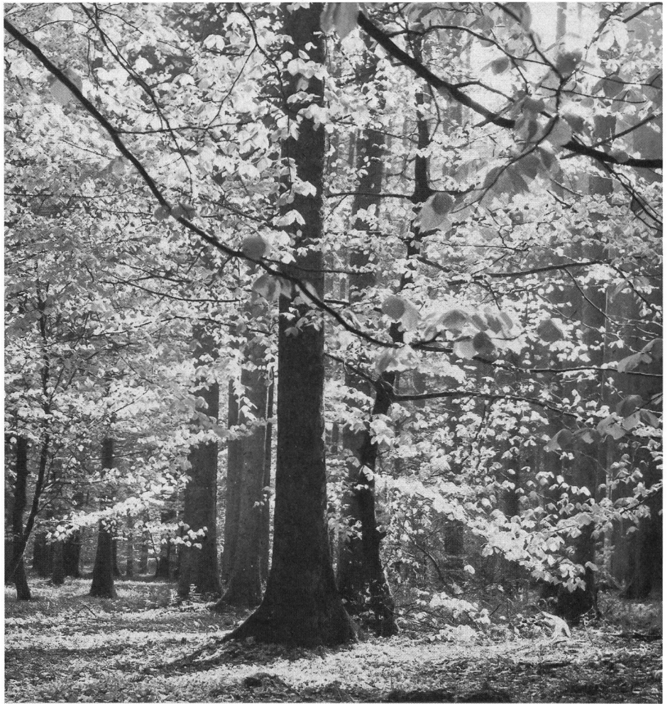
Le sport et la nature devront apprendre à faire bon ménage.

Les grandes manifestations sportives, grâce à la mobilité et à la disponibilité du public, pourront certainement relever le défi de l'an 2000 en augmentant l'impact des grands événements (compétitions ponctuelles à grande