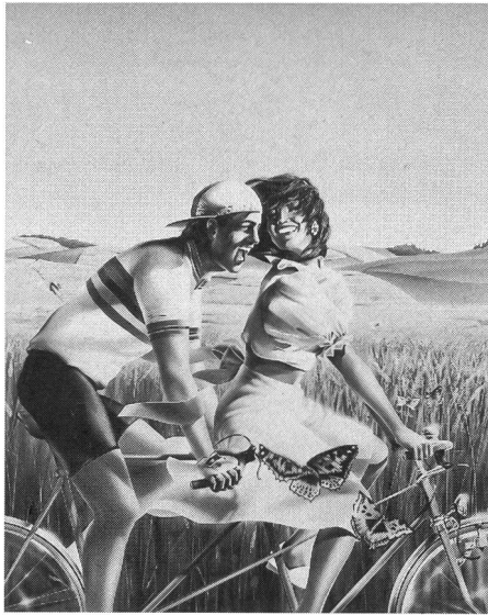
Le rêve et l'aventure, le sport et l'amour: Illusions? Mirages?...

D'importants changements peuvent aussi être constatés en ce qui concerne les installations sportives , où deux tendances semblent s'opposer; d'une part, les installations à caractère commercial, qui évoluent de plus en plus vers des lieux exclusifs et luxueux où l'homme vit ses loisirs, où sport et culture s'associent à sauna, snack-bar et salle de cinéma et, d'autre part, une grande affluence dans des disciplines