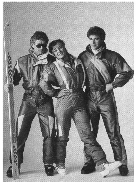
Le champion – ici, au centre, Maria Walliser – suffit souvent à faire la qualité d'un produit: la publicité le sait et s'en sert; au prix fort!

Deuxièmement: le sport, en tant qu' activité de loisirs largement répandue, représente un défi économique pour l'industrie, le commerce, le secteur de la construction et le tourisme. Lorsque le plus sportif de nos conseillers fédéraux cite des chiffres, il sait de quoi il parle: chaque année, plus de 7 milliards de francs sont dépensés, dans