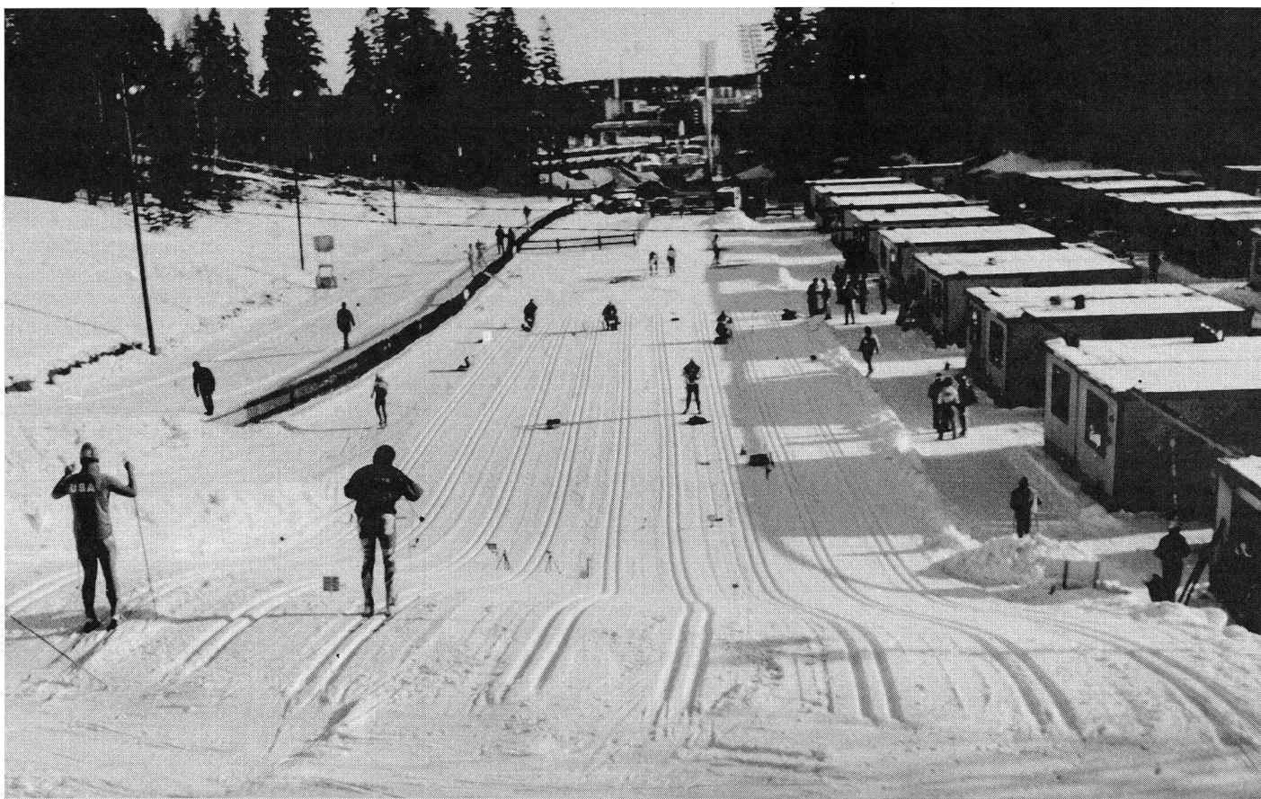
Terrains réservés aux tests de glisse et «cabanes de fartage» (Championnats du monde de Lathi 1989).

A quoi on peut répondre: il ne sert à rien de faire des tests lorsque le vent souffle par rafales, d'autant que la trace