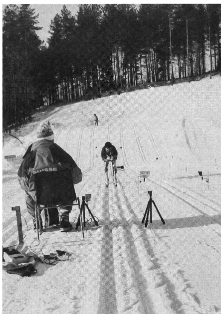
Test de glisse: trace, testeur, cellules électriques et rédacteur du procès-verbal.

Si on teste un fart en vue d'une compétition, les conditions (trace et neige) doivent correspondre à celles que l'on trouvera sur le parcours (il est souvent impossible, voire interdit d'effectuer des tests directement sur la piste).