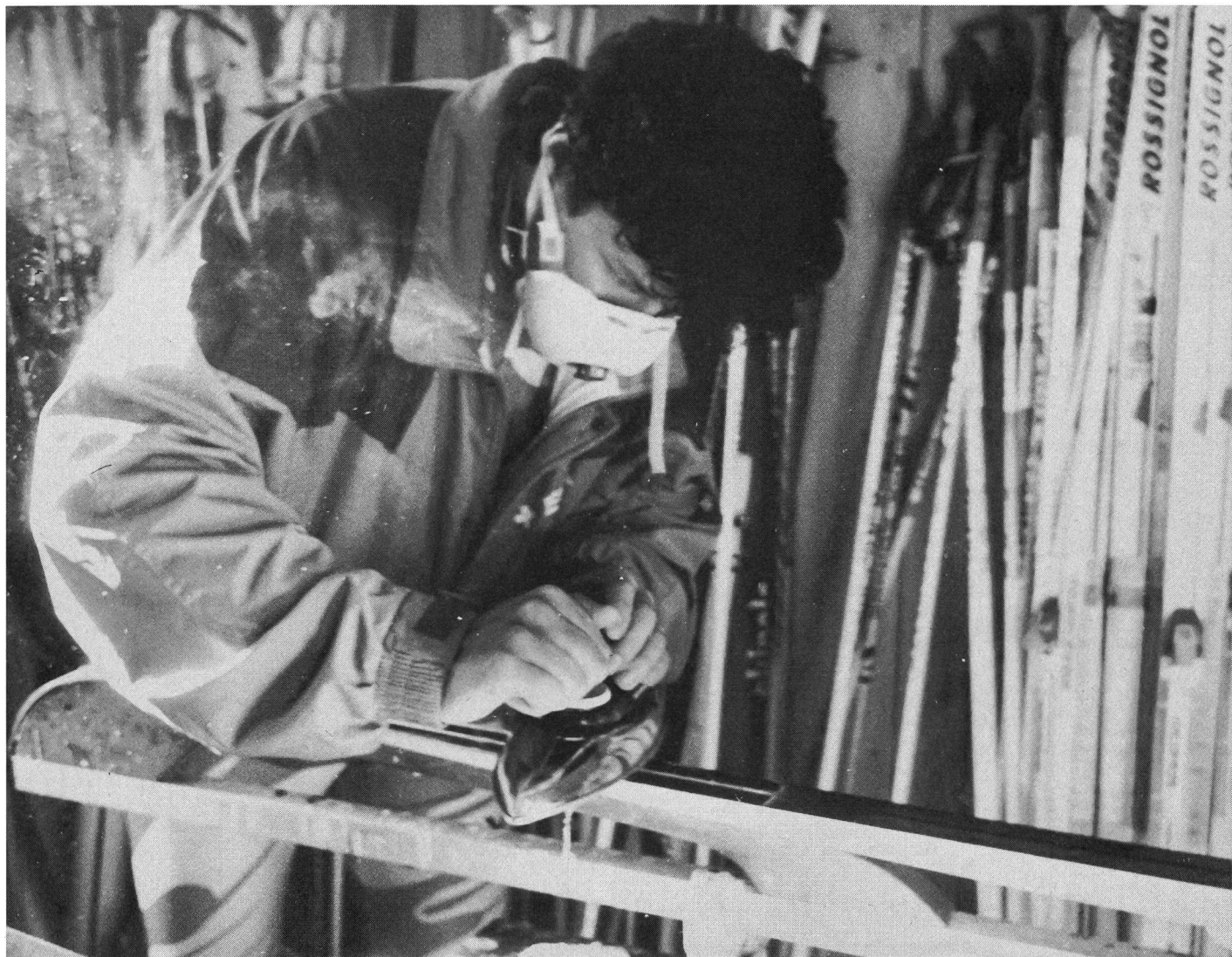
Lissage de la semelle au fer chaud: les farts de glisse modernes en poudre provoquent des vapeurs désagréables.

classiques fartés de la même manière = test des skis):