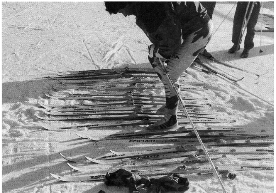
Skis à tester prêts à l'emploi.

Pour les farts de «croche», on tient compte des critères suivants: