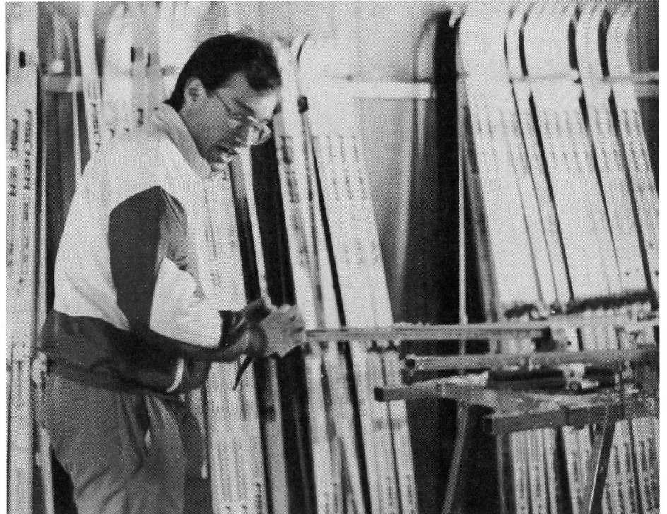
Local des skis et de fartage de l'équipe suisse aux Championnats du monde de Lathi: prêts à la guerre du matériel!

Suivant l'ampleur du test (nombre de courses nécessaires) et l'objectif visé, on choisit une fourchette étroite pour satisfaire aux exigences de l'entraînement de base ou de perfectionnement. Il ne faut pas que le facteur «fatigue» exerce une influence sensible sur le test; au besoin, on compensera en modulant les conditions de réalisation du test. Pour le test des skis, tous doivent être préparés de la même manière. Les skis classiques doivent avoir une adhérence égale et suffisante. Le test des farts de glisse peut être conçu sous la forme d'un test «croisé». Avec des skis «identiques» ou, du moins, avec des