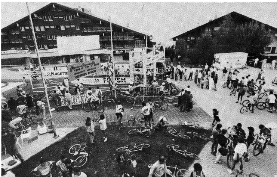
Anzère, place du village: les préparatifs battent leur plein. Un peu anxieux, les concurrents achèvent leur mise en train sous l'œil intéressé des passants.

La Fédération suisse de Mountain Bike a vu le jour en 1985. Forte de 400 membres en 1988, elle en compte, aujourd'hui, plus de 2000 déjà. Son président, Roger Parrat, a d'emblée mis sur l'entente par la discussion et la négociation avec les représentants du WWF, avec ceux, aussi, de la protection de la nature et des chemins de randonnée. Finalement, un accord a pu être trouvé permettant au VTT, à l'homme et à la nature de cohabiter. En conséquence, il est aujourd'hui autorisé d'organiser des compétitions, mais en des