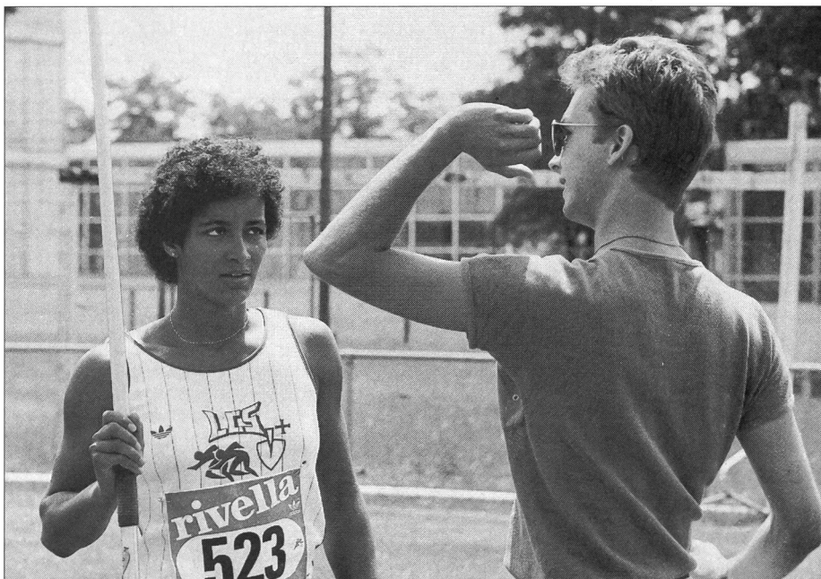
Favoriser les échanges.

Saurons-nous saisir cette opportunité? ■