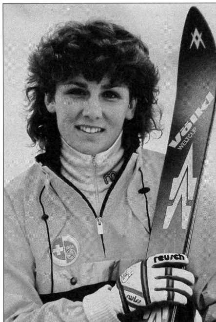
Pour des raisons publicitaires, donc commerciales, le ski du champion (ici Maria Walliser) est presque aussi souvent à côté de lui que sous son pied. Qu'en sera-t-il des pools de fabricants entre équipes de l'Europe des Douze?

bre concurrence des biens et services. En effet, l'échéance du premier janvier 1993 marquera, pour le sport comme pour d'autres secteurs, la levée d'obstacles économiques et techniques; de nouvelles opportunités de marchés et simultanément de réduction des coûts en résulteront sans doute pour l'industrie du sport en Europe.