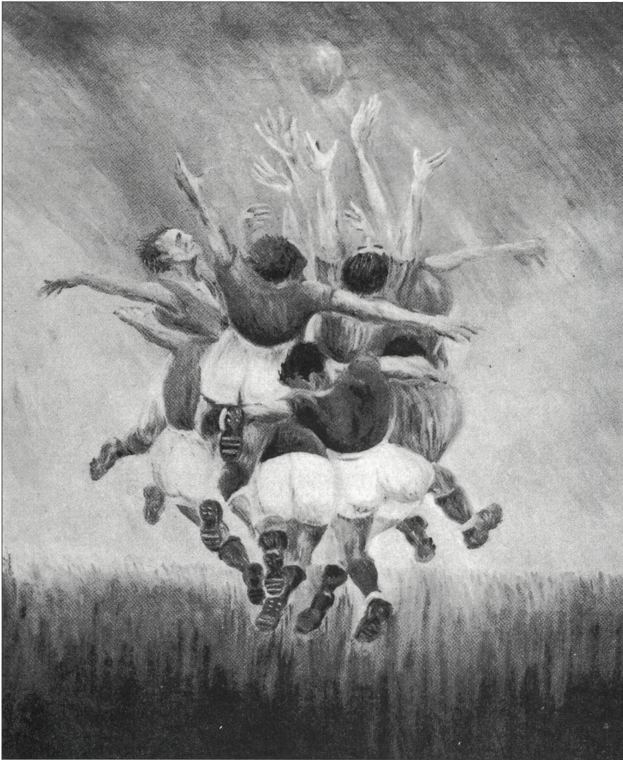
La «gym» balayée par la fascination du rugby.

le sport pour meubler la journée? Il offre d'abord des spectacles sains, récréatifs et vivifiants, puis de roboratifs sujets de lectures et de réflexion, de passionnants motifs de discussion... La plume acérée de Marcel Aymé esquisse une image de ce monde paradisiaque où la léthargie sociale et politique sera entretenue par des doses massives de lénitif à base de sport.