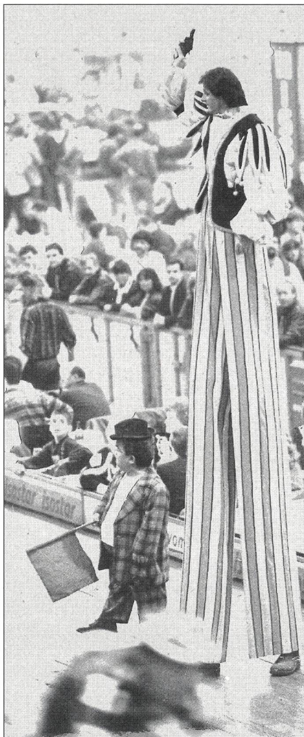
Le sport est beau, le sport est bon, le sport est sain, mais il peut être aussi tout le contraire! Tragi-comédie...