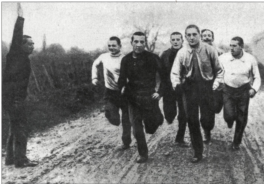
Jean Bouin et Georges Carpentier ou de la culture physique au spectacle.