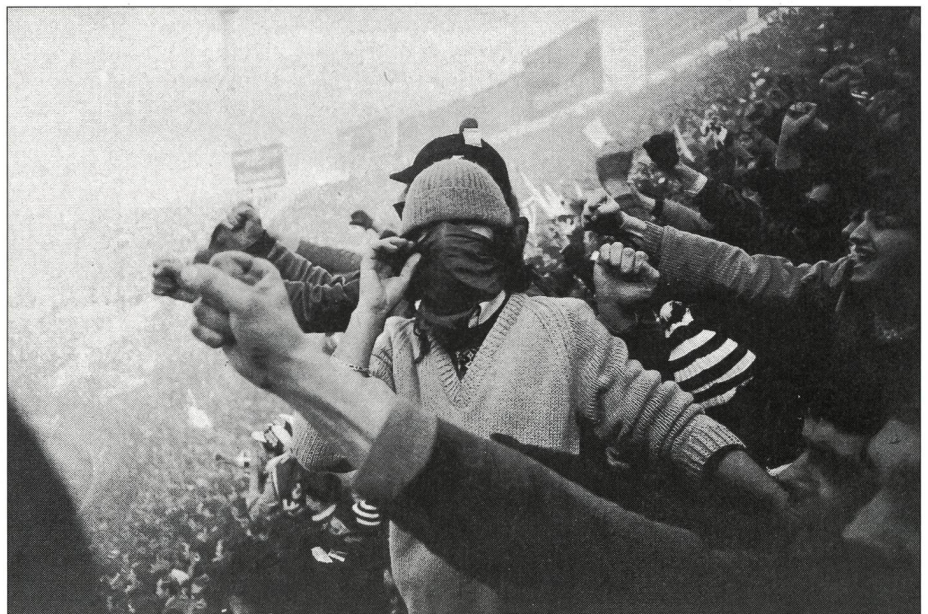
La violence et les «délices mystérieuses des grands troupeaux».

L'équipe de sport ou le champion local ont été très tôt affublés du rôle de porte-drapeau. Déjà Rémy Saint-Maurice décrivait lespires démentes de la vanité 16 qui s'emparent non pas tant de l'idole elle-même que de tous ceux sur qui sa gloire vient rejaillir, gens de sa bourgade, de son petit club d'origine, jusqu'au chanoine de sa ville natale! Saint-Paulien montre aussi à quel point une telle passion peut déborder sur l'ensemble de la vie. Son roman Double-cœur nous introduit dans une petite cité du Sud-Ouest de la France, où le rugby est tout: