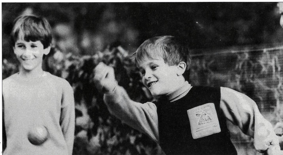
Bouliste de demain.

Dans tout sport, l'alimentation joue un rôle important. La règle: «pas d'abus» est également valable pour ceux qui pratiquent le jeu de boules comme sport. En adoptant un régime simple et bien suivi, le joueur de boules se sent en forme et peut bien se concentrer sur le terrain. Il convient de supprimer les boissons glacées ou gazeuses et de consommer, de préférence, du thé sucré ainsi que de l'eau minérale pour compenser les pertes d'eau dues à la transpiration. Le matin, prendre un petit déjeuner substantiel et, durant la journée, des casse-croûte fréquents et légers. Supprimer aussi l'alcool et la fu-