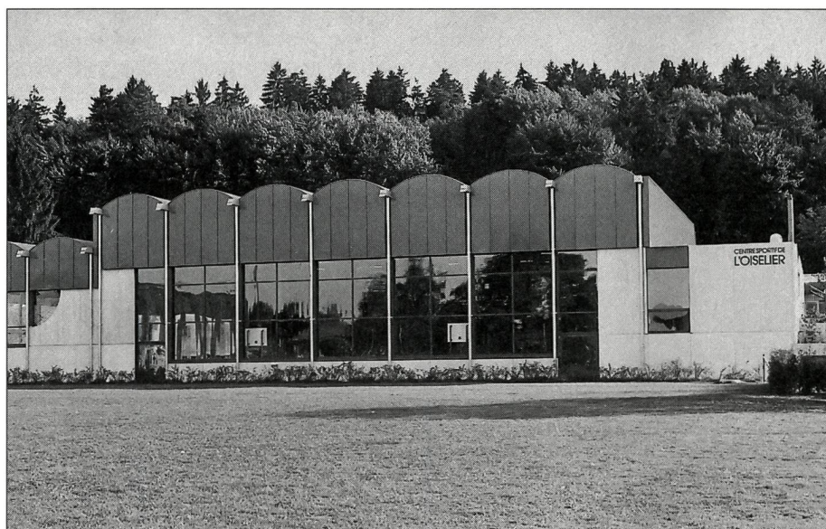
Centre sportif de l'Oiselier, à Porrentruy.