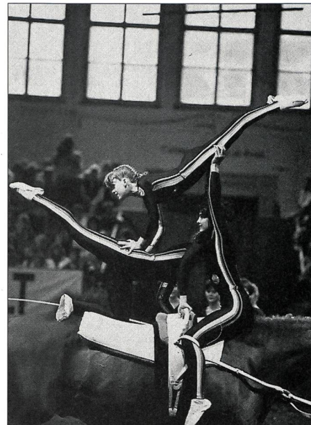
Le «libre» des Suissesses.