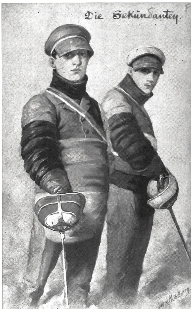
Entre 1910 et 1915.

se croyaient immortels? N'est-ce pas encore dans l'Allemagne des années 1920 que les artistes de la «Neue Sachlichkeit» ont présenté une vision froide, urbaine, mécanique de l'athlète 2 qui, après la Valori Plastica des peintres italiens, donne un éclairage instructif de cette période tourmentée? Le sport a ainsi été mêlé jusque dans ses représentations artistiques aux tendances politiques et culturelles d'une époque: surtout dans les pays totalitaires. Aujourd'hui, le sport reste encore la figure emblématique de la société de consommation pour les artistes pop-art comme Télémaque, Rancillac, Roy Lichtenstein ou Andy Warhol, ou les caricaturistes du Herald Tribune, de la Stampa ou du Monde. Le sport n'est-il pas devenu une métaphore universelle qui permet de faire passer des messages? Dans de multiples caricatures, les grands de ce monde jouent au foot, font du tennis, de la boxe, ou devien-