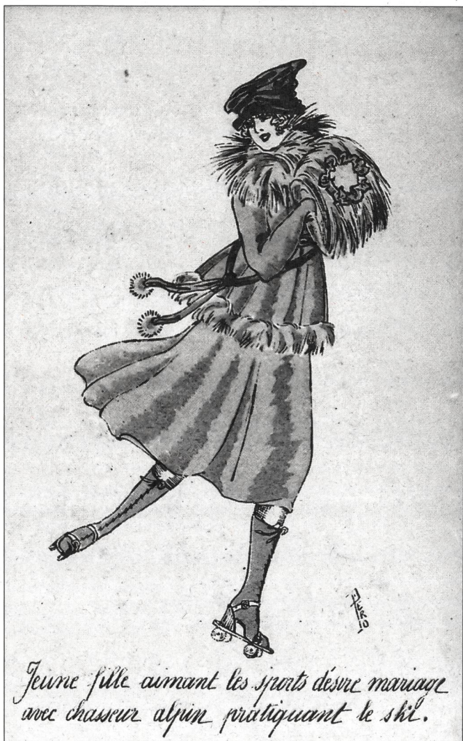
Année 1920. Petites annonces.