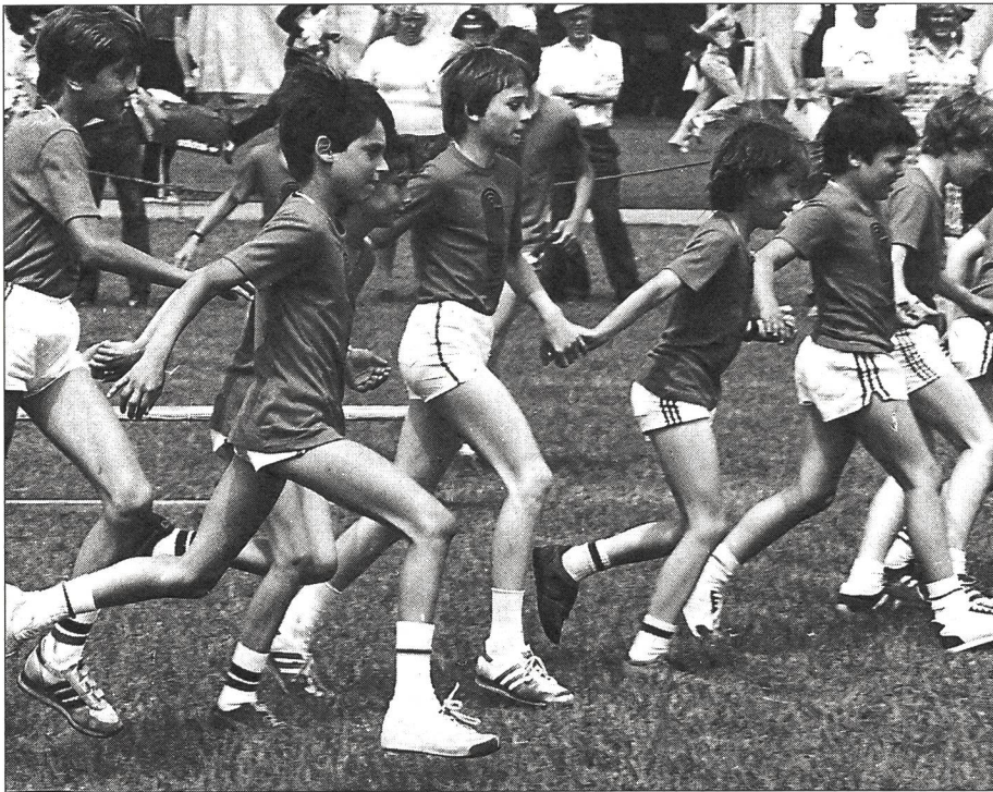
L'avenir de J+S? On y va, main dans la main!

autrement dit la politique, aura un rôle capital à jouer. C'est la raison pour laquelle je vais vous présenter mes thèses politiques relatives au sport de la jeunesse.