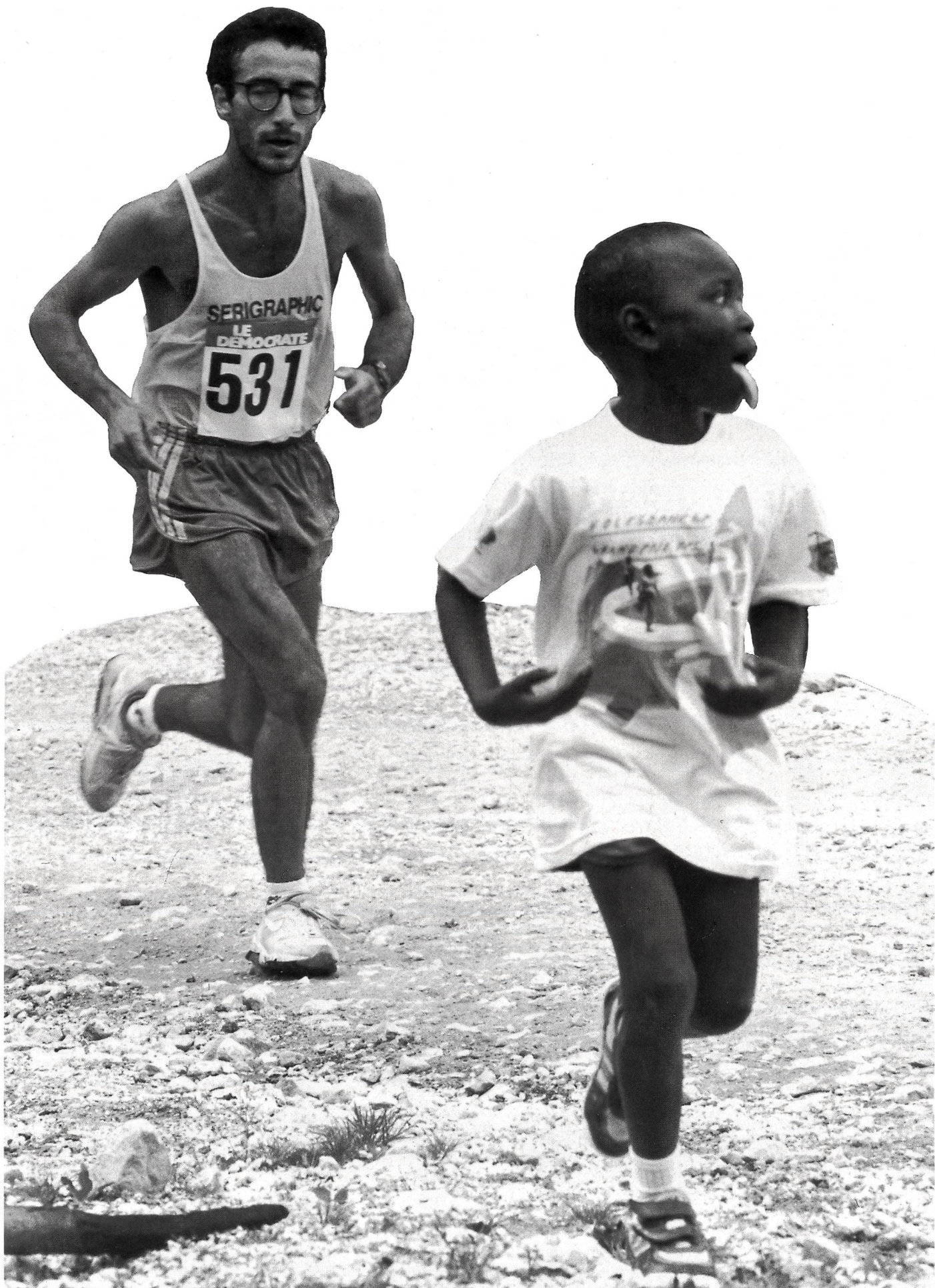
Barcelone, c'est loin encore?...