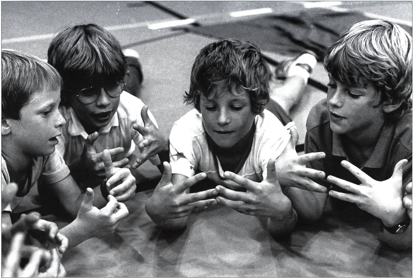
Jeunesse + Sport dès 10 ans? Pour demain peut-être...