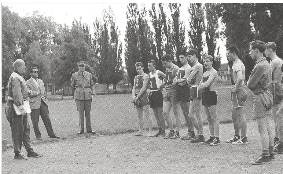
Un cours EPGS, quelque part en Suisse.

n'empêcha pas la cohabitation, une collaboration efficace et l'ouverture vers d'autres domaines «représentés, partagés et défendus» par Macolin: le sport des adultes d'une façon générale (sport de loisirs aussi bien que sport d'élite), le sport et la santé, les sciences humaines