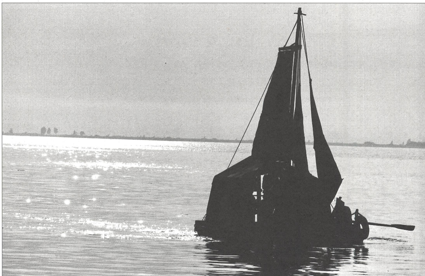
Le départ du voilier solitaire...

ces transferts avec beaucoup d'intérêt et d'émotion. Ces événements ont contribué à motiver et à dynamiser l'action que j'aurais à poursuivre jusqu'à ce jour. Les onze ans que j'ai passés en communion étroite avec la revue, avec mes collaboratrices et collaborateurs, avec les auteurs et les traducteurs, avec les photographes et les dessinateurs, avec les lecteurs, surtout, qui sont la seule véritable raison d'être de l'entreprise, ont été, pour moi, des années bénies... ■