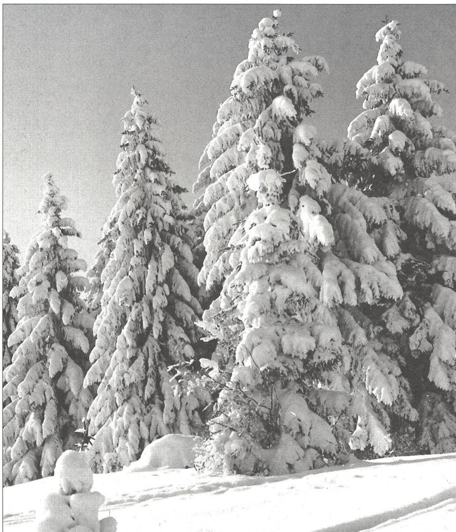
Paysage hivernal à Macolin.

Dans le but d'ouvrir la voie, «Jeunesse forte – Peuple libre» prit l'appellation de