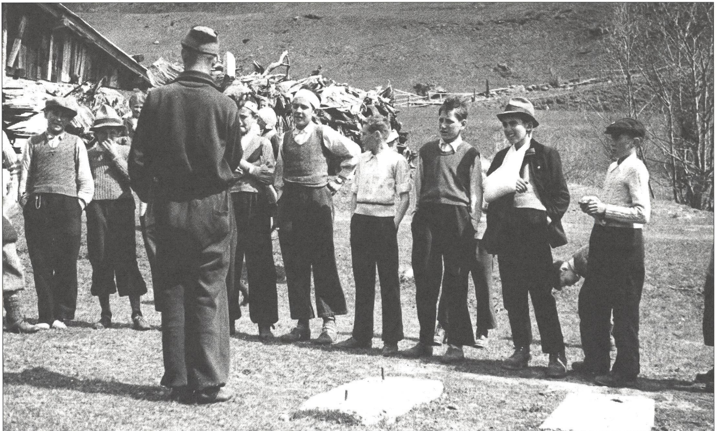
C'est du sérieux, les amis: courir, sauter, lancer... Ce pourrait être à St-Ursanne...

Dès cet instant, je ne me rendis plus compte de rien. Les événements me véhiculaient et c'est dans une inconscience presque totale que je me trouvai sur la ligne de départ de la «course d'endurance»: Jusque tout là-bas au fond, et re-