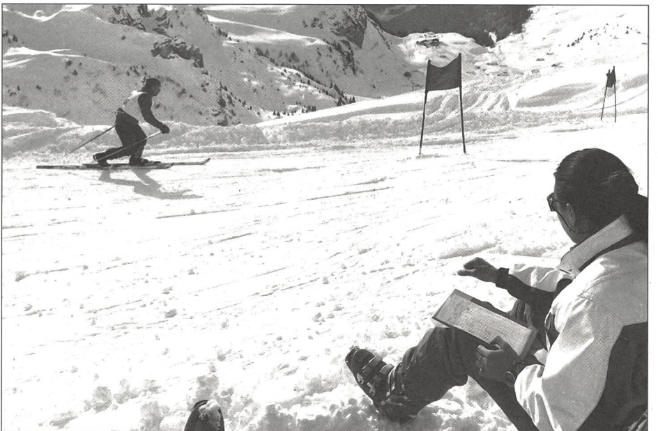
L'œil averti du juge contrôle le passage correct des portes dans le style télémark.