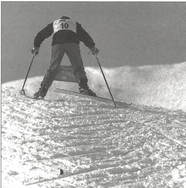
La montée en ciseaux coûte de l'énergie et coupe le rythme.