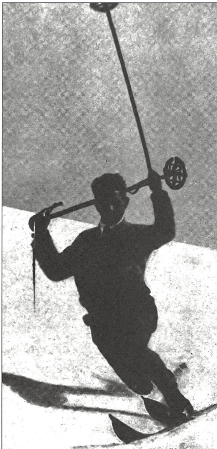
Virage en télémark, bâtons levés (selon Dahinden).

Les considérations émises par Dahinden sur l'apprentissage du programme – même s'il n'a jamais utilisé ce terme – avaient quelque chose de révolutionnaire. Il a en effet découvert très tôt qu'apprendre à skier, c'était d'abord acquérir la maîtrise d'une sorte de programme de base qu'il s'agissait volontairement ou impérativement d'adapter, dans sa forme extérieure – on parlerait, aujourd'hui, de composante variable – aux exigences momentanées du terrain: Celui qui s'applique à progresser ne doit donc plus, comme cela se fait traditionnellement, apprendre une multitude de formes de mouvement différentes, de courbes et de virages; il lui suffit, au contraire, de convertir et d'appliquer au ski comme il se doit un seul mouvement élémentaire: celui de la marche. A ajouter à cela cette indication évidente qui devrait, aujourd'hui encore, servir de critère de discussion méthodologique: Il est inutile de réapprendre, il faut apprendre en plus! Ce que le débutant assimile à la base