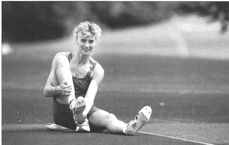
Heike Drechsler, une des athlètes féminines les plus chargées de titres et de records, a émergé de RDA «vent debout» – celui de l'esprit sportif – ce qui n'a pas été une moindre affaire.