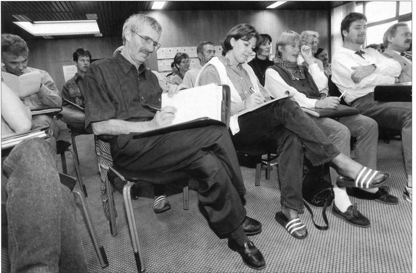
Arène sportive de Klosters: travail...