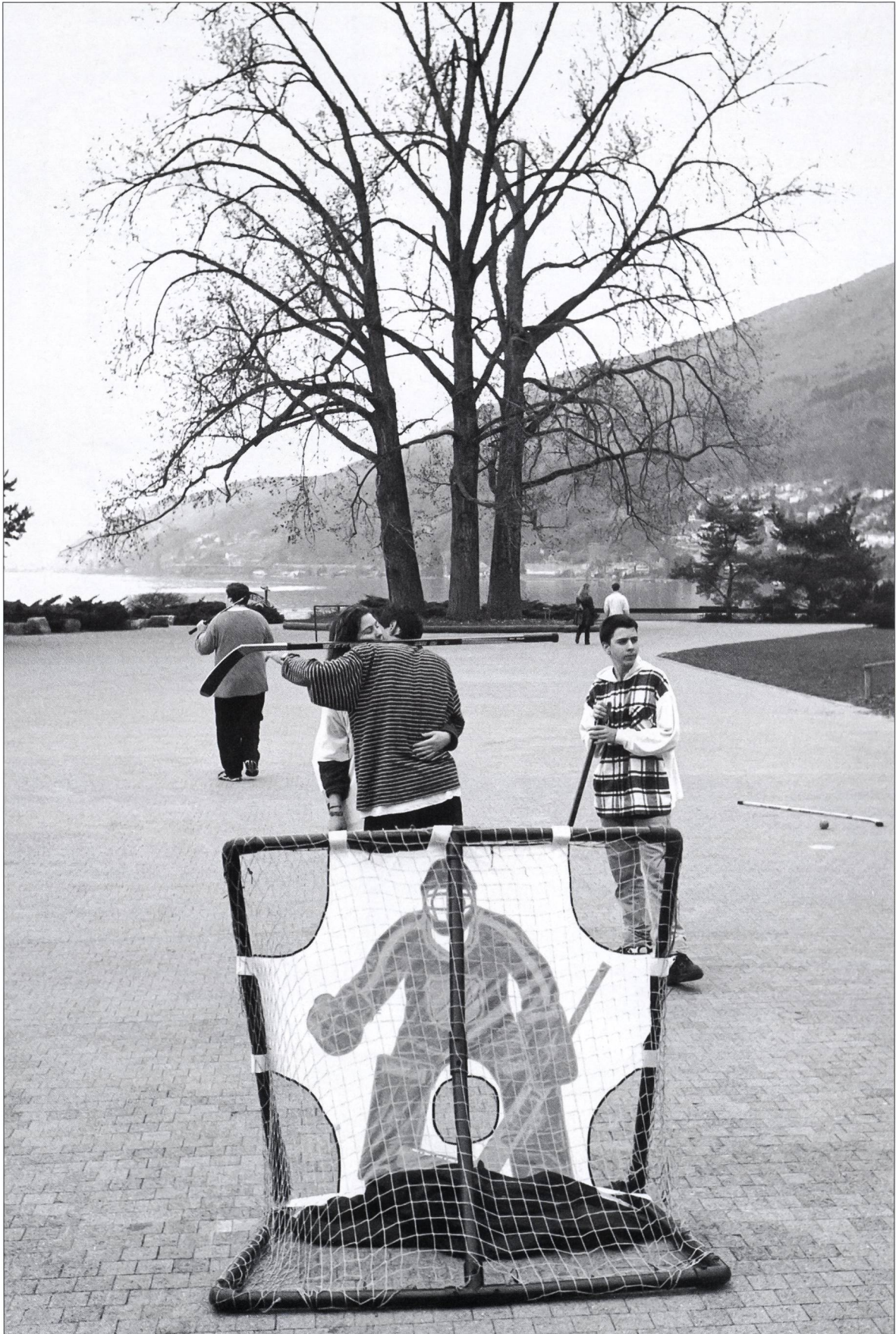
Lac de Bienne. Printemps 1997.