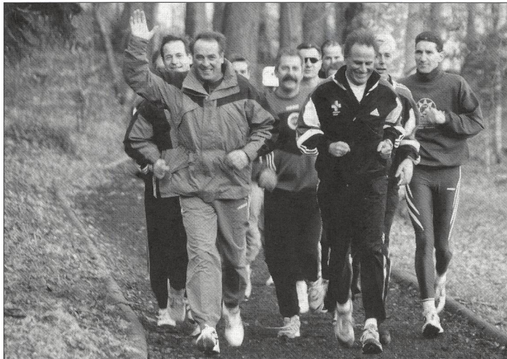
Lors de sa visite à l'EFSM, Adolf Ogi, nouveau Ministre des sports, a donné le tempo.