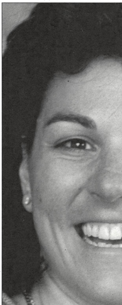
Le regard, reflet de la personnalité.