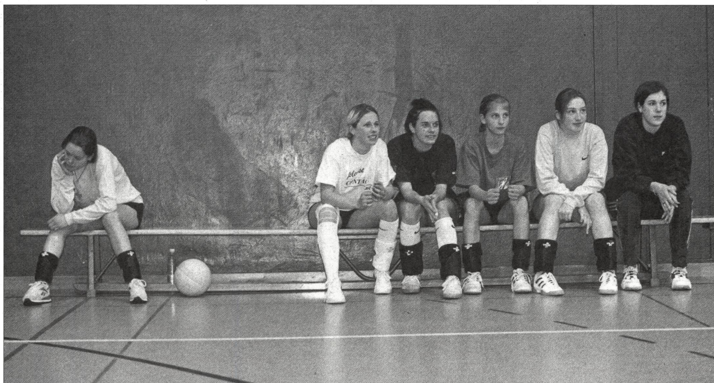
Joueuse remplacée assise sur le banc. Déçue, frustrée, seule. Une scène que l'on voit dans tous les sports d'équipe.

Gordon, Th.: Comment apprendre l'autodiscipline aux enfants. Eduquer sans punir. Ed. le jour, Québec 1990. ■