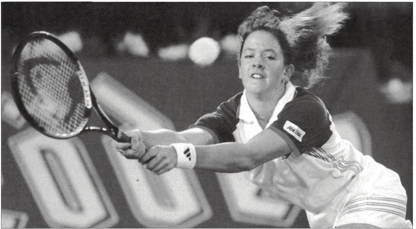
Patty Schnyder, un talent qui a fait son chemin jusqu'à l'élite mondiale.