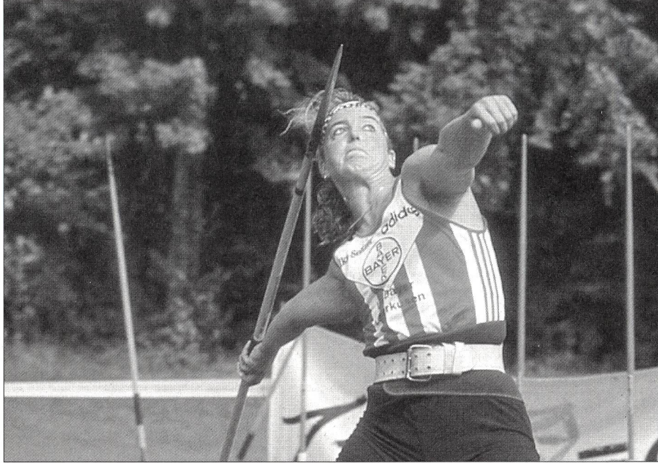
Qu'est-ce que fera Steffi Nerius après le sport?