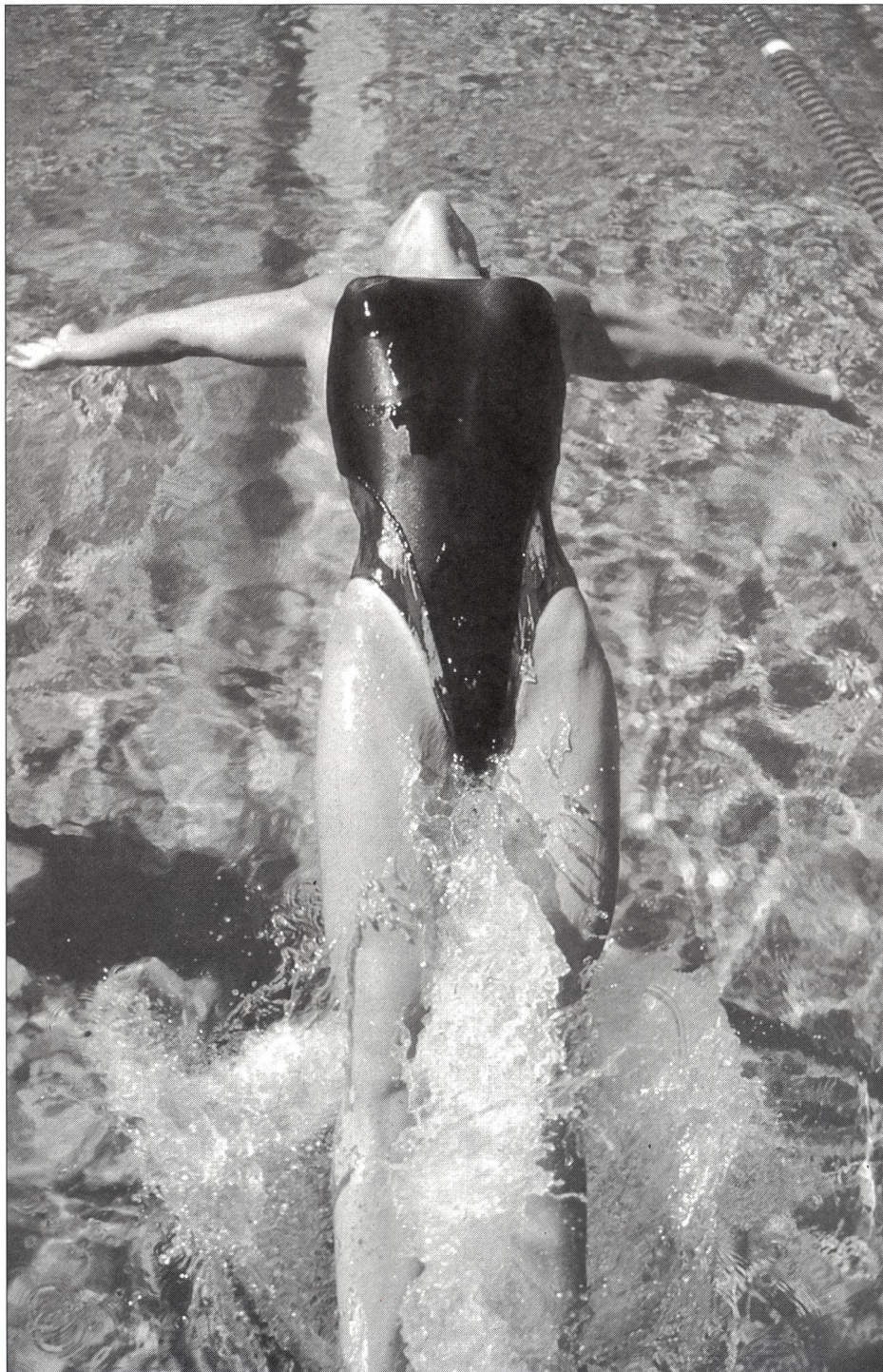
Les nageurs, les boxeurs, les gymnastes à l'artistique et les judokas sont quelques exemples parmi d'autres à avoir participé à l'enquête.

Cet article, synopsis de la contribution apportée par la France à l'étude trinationale (Allemagne – France – Suisse), expose les résultats d'une enquête faite auprès de 220 sportifs de haut niveau et relate les entretiens approfondis avec 22 d'entre eux correspondant aux critères fixés.