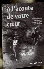
A l'écoute de votre cœur (1997) Fr. 19.80/17.80