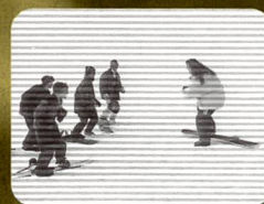
Cinq choisis parmi 100 000... ou: qui sont les monitrices/moni- teurs Jeunesse + Sport? (1997) Fr. 32.40