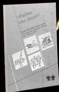
Faites vos jeux! (Recueil de cahiers pratiques 1992-95) Fr. 30.-/Fr. 25.-