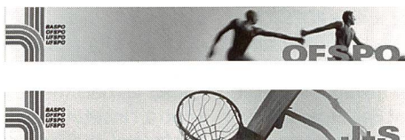
Des pages attractives et enrichissantes à consulter sur Internet dès décembre 1999.

Sport de camp: cette page comprend de nombreuses listes de contrôle ainsi que des «boutons» permettant l'accès aux «Nouvelles» au «Dossier CP» à la «Pratique» ainsi qu'à la «Documentation».