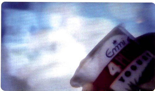
Spot TV: Emmi Schweiz AG, Lucerne

« Quand l'argent a la mainmise sur la santé et le bon sens. »