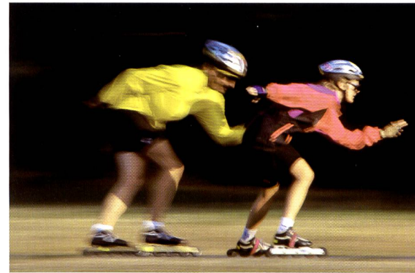
Certains enseignants se sentent parfois dépassés par les sports à la mode.

capables de meilleures performances qu'eux. Vient s'ajouter à cela, l'âge venant, une diminution des capacités physiques. Les blessures, et peut-être plus encore l'usure de l'organisme, sont susceptibles d'engendrer un sentiment de diminution de sa capacité d'action et peuvent être perçues comme une menace à son encontre.