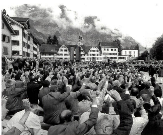
Les délégués ne manqueront pas d'assister à la traditionnelle «Landsgemeinde» qui suivra leurs débats matinaux.

Le dimanche matin, l'assemblée des délégués sera suivie, comme à l'accoutumée, de la «Landsgemeinde», qui se tiendra à Glaris. Les votes porteront sur trois thèmes importants, à savoir: la nouvelle loi sur la formation, les subventions cantonales pour le centre sportif de Glarner Unterland et la route de délestage qui mène de Näfels à Glaris. Les débats s'annoncent passionnés, mais ne manqueront pas de déboucher, comme à l'assemblée des délégués de l'ASEP, sur des décisions traitées en toute démocratie. m