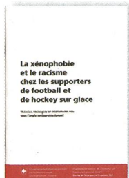
Zimmermann, D. (2005). La xénophobie et le racisme chez les supporters de football et de hockey sur glace. Berne, Département fédéral de l'intérieur, 49 pages.

Pour des jeunes souffrant de troubles de la personnalité et du comportement, le défi est de taille: en effet, il ne s'agit pas seulement de cohabiter à bord, de faire la cuisine et de tenir la barre. Cet atelier voile interdisciplinaire inclut de l'enseignement sur l'eau et à terre, un encadrement psychologique avec des temps de réflexion autour des sorties, des ouvertures sur l'extérieur de l'institution (notamment des présentations aux parents et même une animation au salon du livre de Genève!). L'apport pédagogique fait la part belle à la connaissance de l'environnement, la lecture de carte, l'orientation à la boussole et propose de nombreuses expériences concrètes (relevé des températures de l'eau, observation de la faune et de la météo, etc.). Enfin, la réalisation d'un journal de bord permet aux enfants de verbaliser leurs aventures, de les inscrire dans le temps et de maîtriser le traitement de texte. Le lecteur accompagne ces six matelots en herbe dans leurs peurs, leurs mésaventures techniques, leurs blocages, leur refus parfois, mais surtout dans leurs progrès, leur bonheur, leur apprentissage de l'autonomie ou de la réussite. Marianne Chapuisat