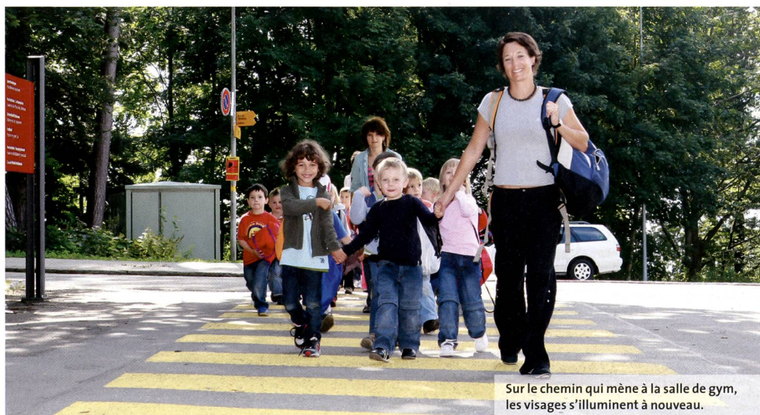
Sur le chemin qui mène à la salle de gym, les visages s'illuminent à nouveau.