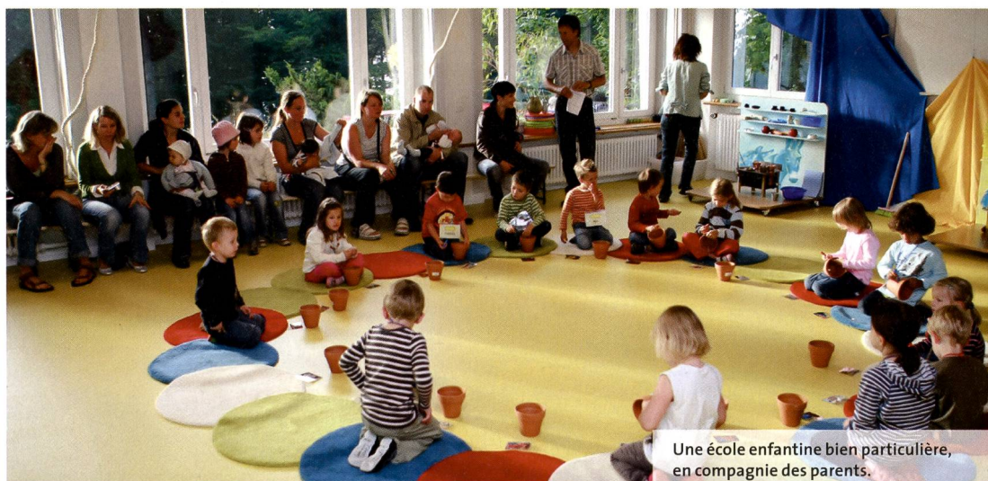
Une école enfantine bien particulière, en compagnie des parents.