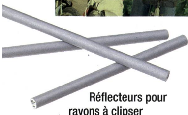
Réflecteurs pour rayons à clipser