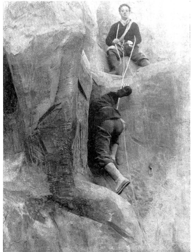
Il gruppo ticinese all'assalto della roccia artificiale

Riteniamo che incontri fra rappresentanti dei cantoni abbiano a essere rinnovati ogni anno: nella suggestiva e simpatica cornice di Macolin il motivo della giornata del 28 maggio all'HYSPA potrebbe essere ripetuto con le immancabili modifiche che si impongono per un'organizzazione così impegnativa che però potrebbe essere semplificata. Sarà bene parlare di ciò in una prossima riunione fra i dirigenti dell' I. P. (a. s.)