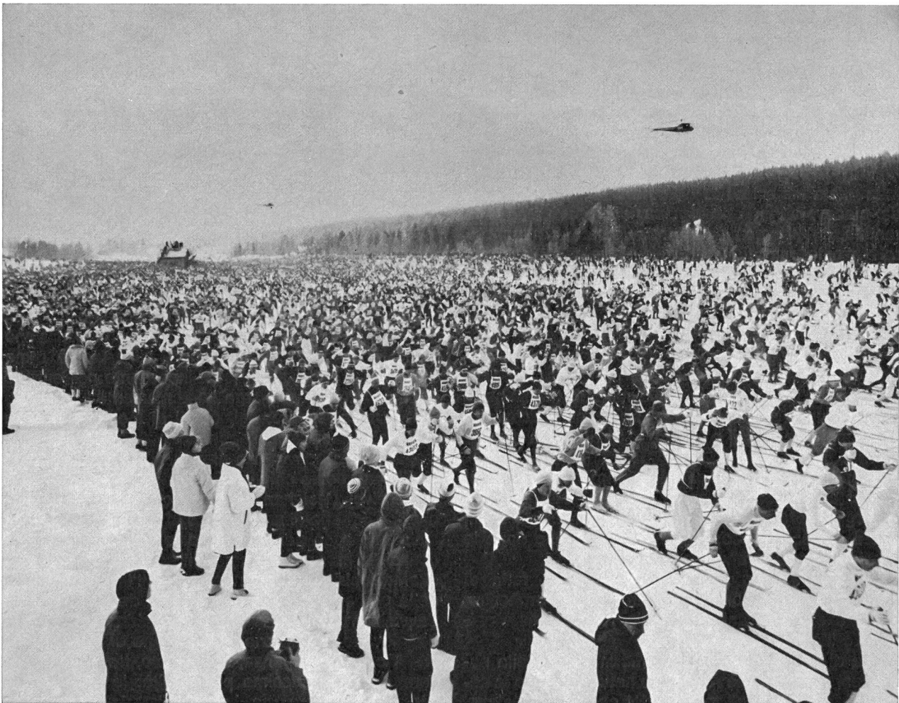
Partenza della corsa di Vasa (Svezia). Si potrà vedere un giorno in Svizzera un simile spettacolo?

Altrimenti detto, degli sci e delle scarpe di fondo IP. Durante l'inverno 1965-66 saranno disponibili 1000 paia di sci