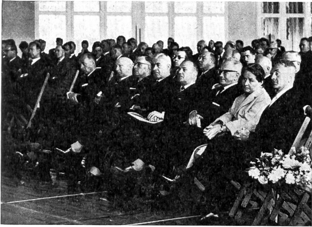
Gli illustri invitati mentre assistono ad una delle numerose esposizioni concernenti l'Istituto di ricerche.

Abbiamo seguito con grande interesse gli sforzi esplicati in questo campo, sforzi che dovrebbero permettere ai nostri atleti di competere con i migliori in condizioni più propizie.