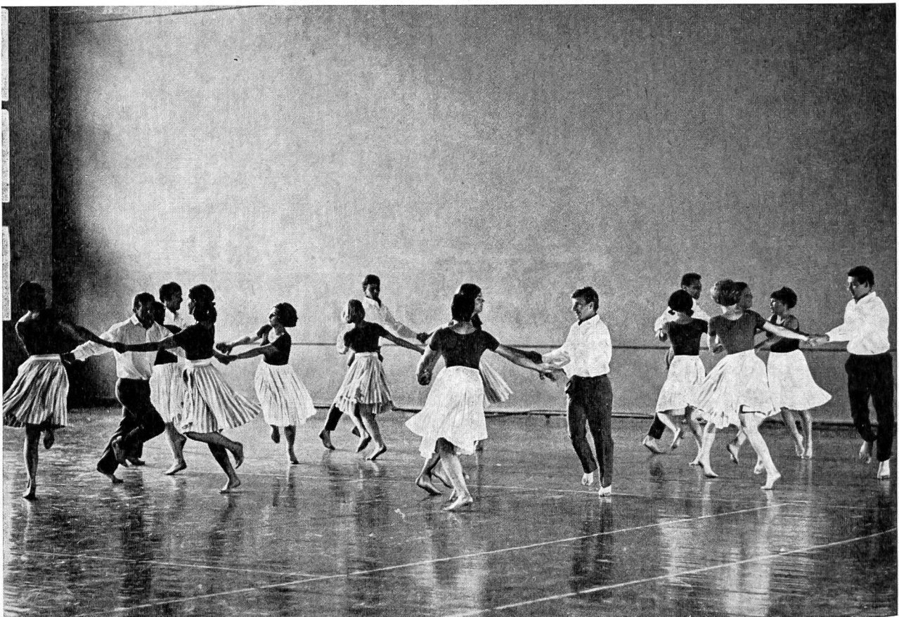
Gli studenti del Ciclo per la formazione di maestri di sport hanno impresso una nota «sportiva» all'inaugurazione, producendosi a svariate riprese. Qui eseguono una danza popolare.

La giornata odierna è una pietra miliare in questa evoluzione. L'Istituto di ricerche, espressione della generosità dell'ANEF nei confronti del movimento ginnico e sportivo, deve aiutarci a meglio individuare le necessità e servire a illuminare il cammino che dobbiamo percorrere. Possa questo cammino condurci alla meta verso cui tutti tendiamo: irrobustire la salute, l'energia e la gioia di vivere degli Svizzeri.