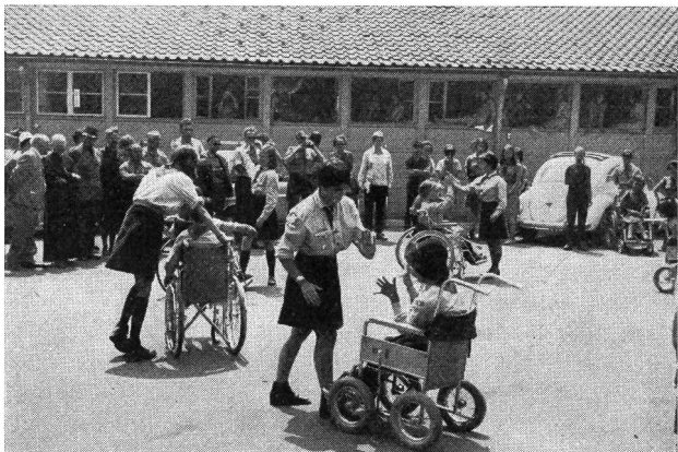
Una riuscita produzione delle « esploratrici a ogni costo »

vacanze offrono, con sacrifici intuibili, il loro tempo libero per mettersi al servizio della fanciullezza, è degna del massimo rispetto e di sincera ammirazione. E non bisogna dimenticare che le caratteristiche del gioco scout sono avventura, vita all'aria aperta, lavoro collettivo, camerateria con altre giovani della medesima età, collaborazione in attività concrete che rispondono sempre ai desideri della gioventù. Libertà, quindi, individualmente consentita, e impegno personale di ogni membro. Non riteniamo — come è stato scritto — che lo scoutismo (che non cessa di interrogarsi) faccia la figura di essere in ritardo poichè rimane fedele ai valori morali e spirituali espressi dalla « legge » e dalla « promessa » e all'idea centrale del servizio. Il fatto che il programma si sia allargato a più vasti orizzonti e si sia adattato alle esigenze della dinamica vita moderna e abbia concesso ai giovani di esprimersi secondo i propri sentimenti e attitudini, è segno indiscutibile di evoluzione, di movimento.