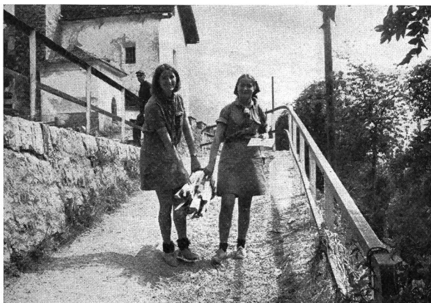
Rifornimenti in legna e ritiro della posta, sempre in Ietizia

vacanze offrono, con sacrifici intuibili, il loro tempo libero per mettersi al servizio della fanciullezza, è degna del massimo rispetto e di sincera ammirazione. E non bisogna dimenticare che le caratteristiche del gioco scout sono avventura, vita all'aria aperta, lavoro collettivo, camerateria con altre giovani della medesima età, collaborazione in attività concrete che rispondono sempre ai desideri della gioventù. Libertà, quindi, individualmente consentita, e impegno personale di ogni membro. Non riteniamo — come è stato scritto — che lo scoutismo (che non cessa di interrogarsi) faccia la figura di essere in ritardo poichè rimane fedele ai valori morali e spirituali espressi dalla « legge » e dalla « promessa » e all'idea centrale del servizio. Il fatto che il programma si sia allargato a più vasti orizzonti e si sia adattato alle esigenze della dinamica vita moderna e abbia concesso ai giovani di esprimersi secondo i propri sentimenti e attitudini, è segno indiscutibile di evoluzione, di movimento.