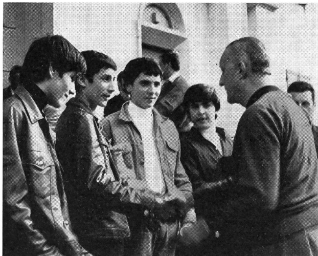
Il quartetto della SAV I di Vacallo (vittorioso nella C) ha dimostrato di sapersi... orientare