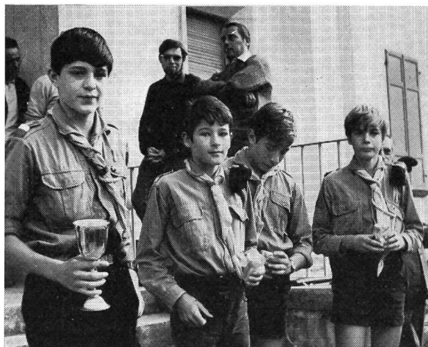
Gli Esploratori AGET di Bellinzona (pattuglia «Teodoro») hanno conquistato definitivamente alla loro società la «Challenge Carlo Grassi» (categoria D)