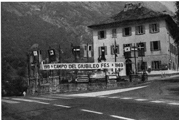
Il quartier generale del campo a Olivone (casa comunale)

Nel motto «Guardiamo indietro fiere, guardiamo avanti fiduciose», con i favori di un tempo sempre splendido, dal 18 al 29 luglio 1969 si è svolto, nella Valle di Blenio, il campo del giubileo per il 50.mo anniversario di esistenza della Federazione delle Esploratrici svizzere (FES). Se si pensa che nella Valle del