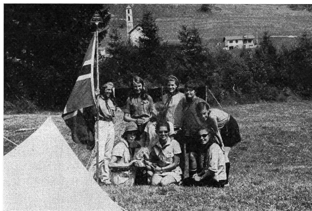
Gruppo di esploratrici straniere al sottocampo di Ronchetto

Il campeggio è stato molto ben concepito su un piano decentralizzato in modo da rispettare l'autonomia delle unità e di rafforzare la vita comunitaria dei piccoli gruppi: per cui in una giornata non abbiamo potuto, è chiaro, visitarle tutte: ma le nostre visite a