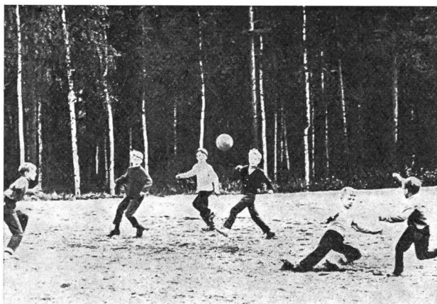
Lo sport che salva . . .

Lo sport è un fine o un mezzo? Quali ne sono i moventi? In qual misura è buono ed in quale è cattivo? Come rico-