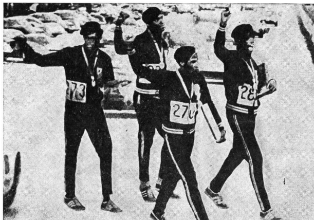
Medaglie che danno del peso ai pugni levati contro certe forme d'oppressione politica.

quando Roger Bannister, dopo aver corso per la prima volta nella storia dell'atletismo i mille metri in meno di quattro minuti, venne inviato dal suo governo in «tournée» pubblicitaria attraverso gli Stati Uniti; ed infine ancora allorchè i visti vengono rifiutati agli sportivi che desiderano passare da un blocco politico all'altro, le due Germanie rifiutano di battersi all'ombra della stessa bandiera, il pugno levato dei Negri americani minaccia la bandiera stellata, il Presidente De Gaulle conferisce la Legion d'Onore ai vincitori olimpionici della sua nazione!