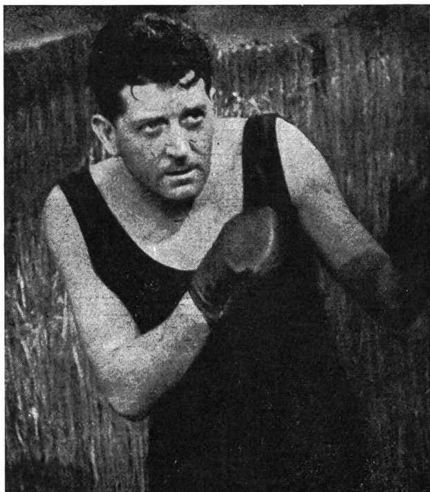
Albert Préjean nel ruolo di Louis Georget nel film «Un soir de rafle» di Henri Decoin, 1932

Presso gli attori si danno molti casi di suicidio e di depressioni nervose; ciò deriva dal fatto che la loro anima, costantemente sovraccarica di altre anime (quelle dei personaggi), è troppo sensibile. Ad eccezione dei pugili, ben inteso, e per diverse evidenti ragioni, rari sono gli atleti che diventano preda della nevrosi. Una parte della energia e dell'alacrità dei muscoli s'è senza dubbio tra-