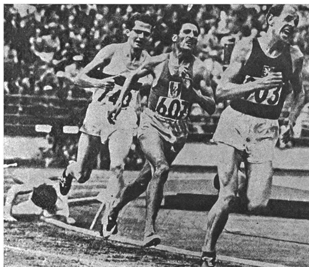
Zatopek vince il drammatico finale dei 5000 metri a Helsinki

Tuttavia, le grandi linee sono certamente definibili. Egli proseguiva: «Le manifestazioni dell'essere umano in preda a se stesso ed alle sue immaginazioni restano così misteriose quanto le correnti marine o magnetiche, il flusso