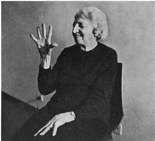
Una mano s'apre, le dita si tendono e, come per incanto, un sorriso rinasce sul viso.

«Allorchè si propone a persone di 60, 70 o ottant'anni di fare della «ginnastica» — dice Louis Perrochon —, si riceve dapprima uno sguardo oscuro e scettico. Solamente dopo sagge dimostrazioni, si ottiene l'adesione degli interessati. Fu necessario far comprendere dapprima che non si trattava d'eseguire delle prestazioni alla sbarra o alle parallele! Difatti — continua l'autore —, sono del parere che bisognerebbe rinunciare al termine di «ginnastica», perchè essa richiama troppo gli esercizi eseguiti a scuola o presso qualche società!»