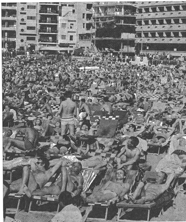
La massa umana, alla quale vengono offerte brutalmente tutte le possibilità di soddisfacimento dei suoi capricci, si precipita frenetica e senza distinguere verso quella possibilità nella quale crede di ravvisare il suo «svago» e la sua «libertà».

Facendo eco ad altri specialisti preoccupati dal fenomeno, Feldheim dubita, d'altra parte, che la scelta dell'espressione «civiltà del tempo libero» sia felice, al fine di definire quale sarà l'avvenire della società, perchè — spiega — «la nozione stessa di tempo libero è polivalente; questa nozione di tempo libero, la quale, secondo Dumazedier, è atta a rispondere a tre bisogni: lo svago, lo sviluppo personale, e, infine, il divertimento». Dalla fusione o combinazione di queste tre funzioni, quale controparte del tempo lavorativo, dovrebbe nascere l'equilibrio psicosomatico dell'individuo.