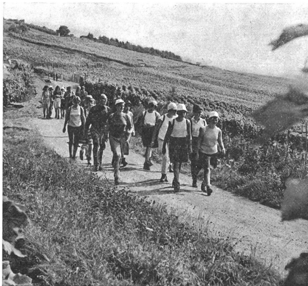
Ridare l'amore per la natura e lo sforzo.

In tal modo, l'eccessivamente brusco sconvolgimento delle strutture sociali, industriali ed economiche, finì per mettere l'uomo sulla corda tesa. Basta un soffio per farlo oscillare dalla parte buona, permettendogli così d'approffittare della sua fortuna e di trarne il massimo profitto; ma un'altra spintarella può anche farlo cadere dall'altra parte e precipitarlo nell'ozio, nella crapula, nella dissolutezza! Basta un nonnulla per indirizzare il tempo libero al vero godimento , o per dirigerlo verso l' ignavia , le comodità o il rammollimento ».