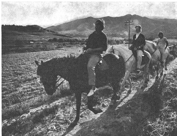
Sfuggire al condizionamento pubblicitario per ritrovare la gioia di vivere!

La nostra prossima puntata ci consentirà di sviluppare quest'ultimo aspetto, dopo averci permesso, nell'interludio, di meditare sul senso profondo delle parole di Paul Chauchard, che dice: