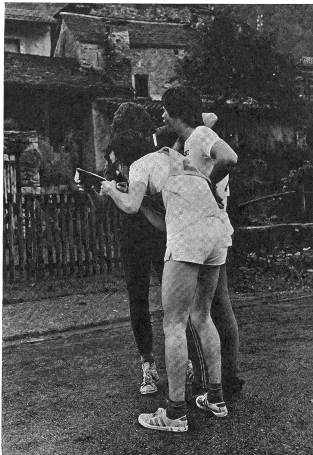
Concentrazione, poi avanti verso il primo punto . . .

Le ragioni di questo nostro nuovo atteggiamento sono diverse e possono essere riassunte, in forma concisa e indicativa, come segue: diminuzione generale della partecipazione nelle corse a pattuglie (aumento, per contro, nelle gare individuali e a coppie); costrizione nella composizione delle pattuglie (la CO di GS è aperta soltanto a giovani di ambo i sessi in età dai 14 ai 20 anni; quindi pattuglie che corrono in formazione . . . «collaudata» non si smembrano per partecipare alla CO condizionata); poi disinteresse da parte di docenti di ginnastica e di monitori e monitrici G+S; anche la grandiosa organizzazione che è uguale per minima o per grandiosa partecipazione; poi ancora perché gli organizzatori incontrano difficoltà nel trovare collaboratori e, da ultimo, forse perché essa CO non entra in linea di conto per la classifica (ufficiosa) del «miglior orientista ticinese» e non è gara competitiva per scudetti. Indubbiamente oggi, con l'ASTI, con la quale si è partiti assieme nel lontano 1947, l'Ufficio